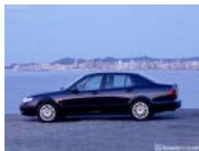
sedan (UK saloon)